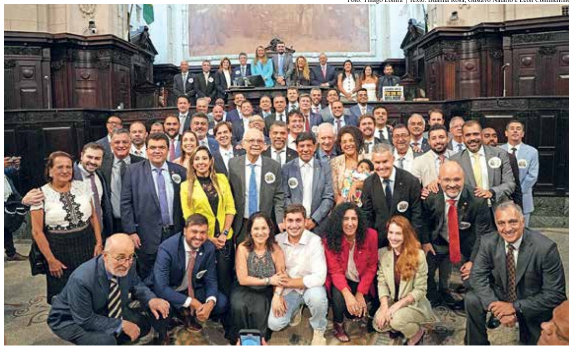
Texto: Buanna Rosa, Gustavo Natario e Leon Continentino

Bacellar ainda destacou os principais desafios de 2025: "Nos próximos meses temos grandes missões pela frente. Re-