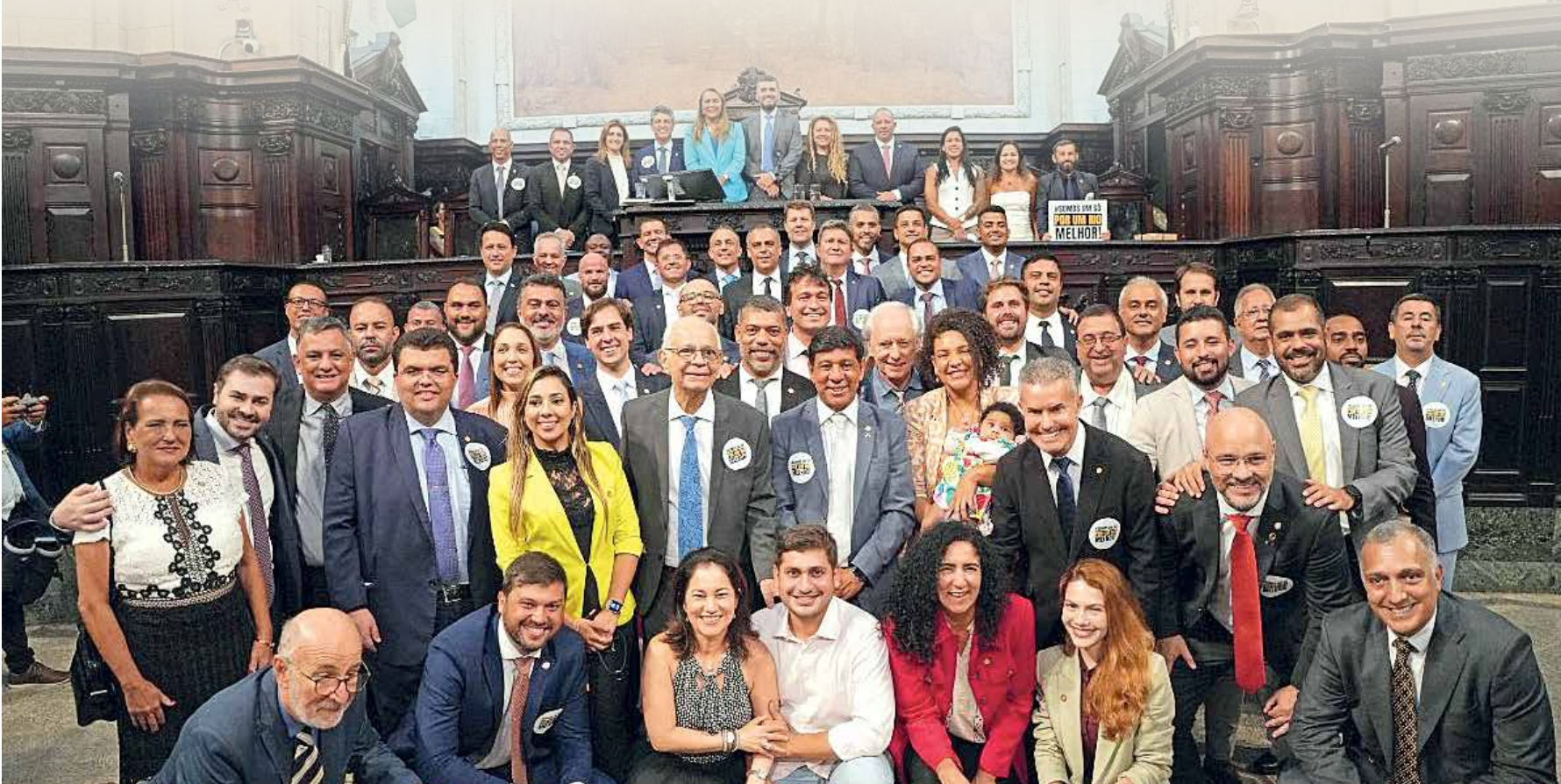
O deputado Rodrigo Bacellar (União) foi reeleito, por unanimidade, presidente da Assembleia Legislativa do Estado do Rio de Janeiro (Alerj). Página 6