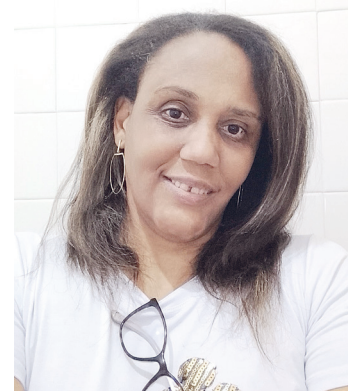
C.Oliveira.L7 siga @cris_leopoldino7

do jovens. Mas é no desfile final que se saberá quem conquistou medalhas por bravura e conseguiu, em meio ao caos, às neuras e às mutilações, manter o coração ainda batendo.